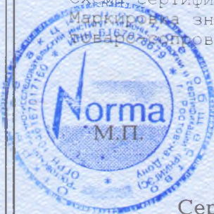
Схема сертификации МЗ Маркировка знаком соответствия по ГОСТ Р 50460-92 на изделиях и в сопроводительной документации